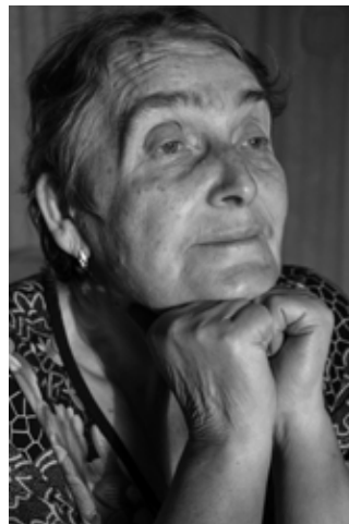
«Тренет души» Мария Колесникова